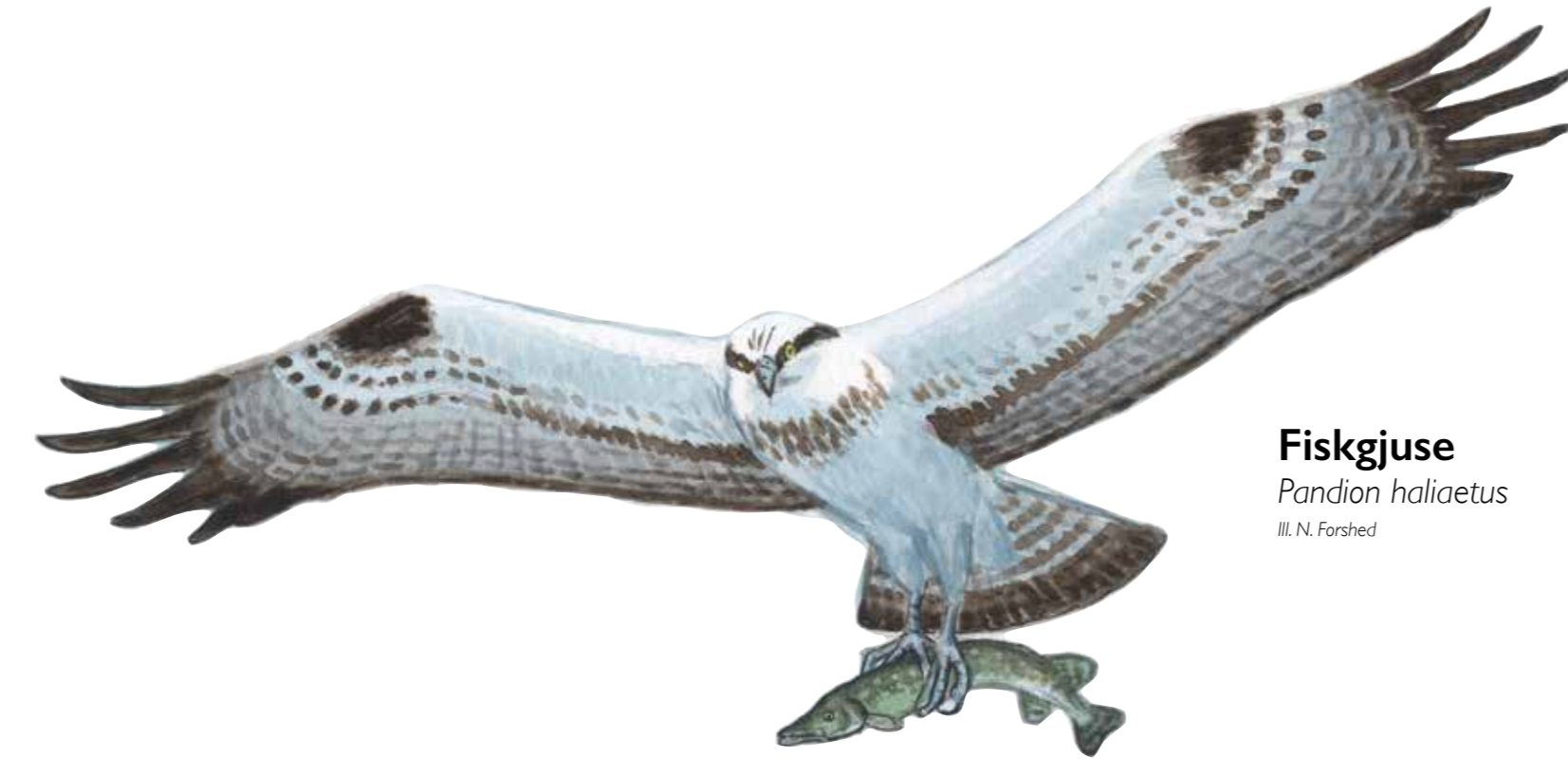
Fiskguse Pandion haliaetus

Velamsund är ett av Nackas mest populära besöksmål. Hit kommer människor året om för att njuta av den vackra naturen, motionera eller bada. Hjärtat i området är Velamsunds gård som har en lång och spännande historia. Naturen i reservatet präglas av gårdens öppna odlingsmarker och mellanliggande skogbevuxna höjder. I reservatet gäller särskilda regler – var mån om att följa dem.