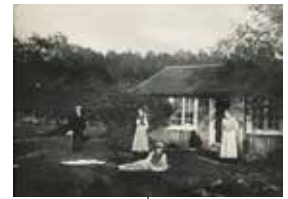
Drängstugan vid Fisksättra gård. Längst till höger står Albertina Lindström, som hyrde stugan. Foto 1918.