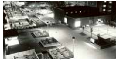
Fisksättra centrum natten efter invigningsdagen i oktober 1974.