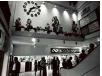
Fisksättra centrum invigdes den 3/10 1974 och Konsum hörde till de första hyresgästerna. Foto Nils Johan Nordenlind, 1974.