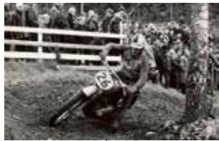
Motocrosstävling på Fisksättra banan. Banan invigdes den 30 juni 1957 och var igång fram till slutet av 1960-talet. Foto 1962.