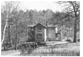
Länno – även kallad Schweizervillan – låg vid Fisksättra hållplats invid järnvägen. Villan från sent 1800-tal revs för att ge plats åt Fisksättravägen. Fotograf okänd. Foto 1968.