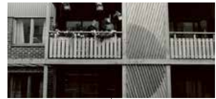
Detalj av miljonprogrammets bostadshus i Fisksättra. Konstnären Lenny Clarhäll har utformat 16 olika träskärmar för ett antal balkongverandor och bostadsentréer. Genom att ändra skärmarnas inbördes placering lyckades han skapa 68 olika varianter, vilket ger liv åt fasaderna. Balkongverandorna skapar en intim miljö och ger en känsla av låg bebyggelse. Foto Ateljé Adolfsen, 1980.