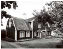
Huvudbyggnaden på Fisksättra gård låg vid nuvarande Hargatan 15. Byggnaden från tidigt 1700-tal revs i slutet av 1960-talet för att ge plats åt det moderna Fisksättra. Under en period fungerade huset som klubbhus för motocrossåkarna. Foto 1955.