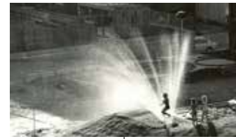
Gräsmattorna vattnas och barnen leker. Foto är taget samma år som invigningsåret 1974.