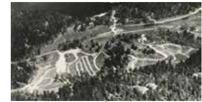
Flygfoto från söder över Fisksättra före den moderna bostadsbebyggelsen. Huvudbyggnaden från 1700-talet syns strax till höger om bildens mitt. På det södra gårdet ses motocrossbanan. Foto 1963.