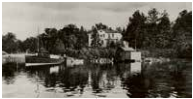
Villa Caprifol vid Lännerstasundet är den enda bevarade byggnaden från det gamla Fisksättra. Det f. d. Baggerska och eldhärjade sommarnöjet från 1880-talet inköptes år 1928 av fröken Siri Svensson. Hon lät återuppföra villan som stod färdig 1930. Foto sent 1930-tal.