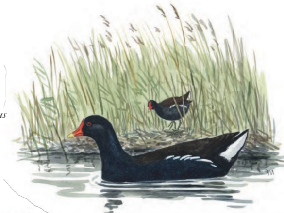
Rörhöna Gallinula chloropus