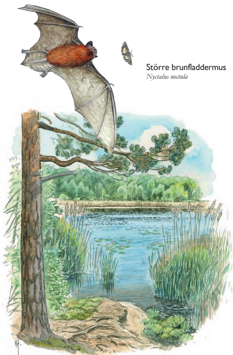
Större brunfladdermus Nyctalus noctula

Tollare träsk is a peaceful spot, well worth a detour, not least if you are interested in birds. From a small bird platform, you can look out across the small fish-free water. From here you may see horned grebe with its cheeky headdress and hear the intensive song of the sedge warbler in the reeds. It is also worth looking and listening out for little grebe and moorhen.