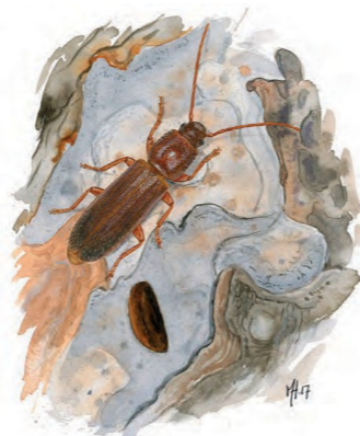
Reliktbock Nothorhina muricata