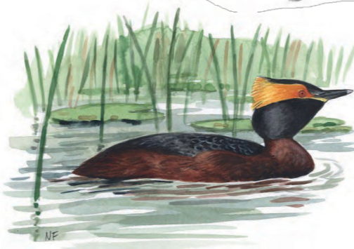
Svarthakedopping Podiceps auritus