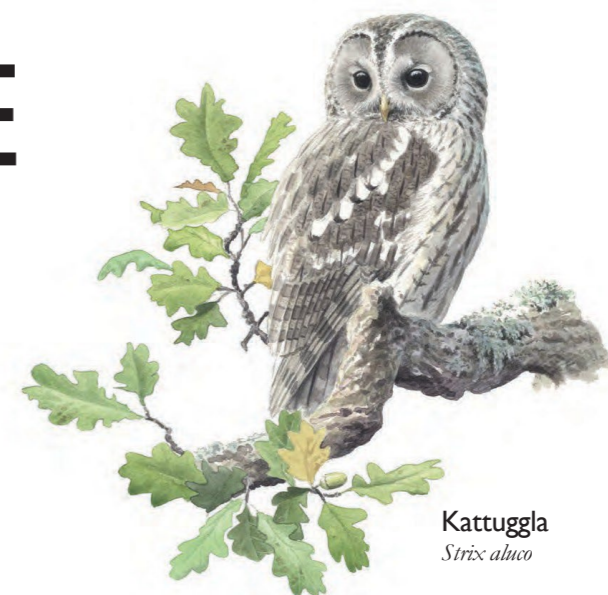
Kattuggla Strix aluco

Naturreservatet Tollare är det största grönområdet i södra Boo och en oas för både människor, djur och växter. Här kan du promenera eller jogga genom rofyllda skogar eller ha picknick på någon av alla fina utsiktsplatser. Mitt i naturreservatet ligger Tollare träsk – en spännande plats med en mångfald av fåglar och fladdermöss.