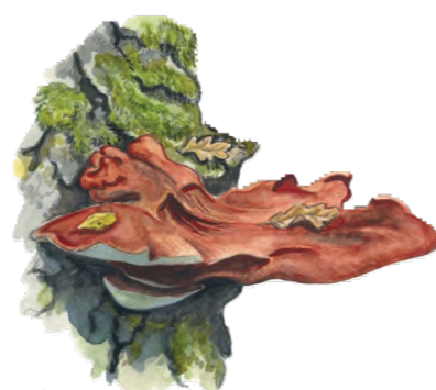
Oxtungssvamp Fistulina hepatica

I naturreservatet finns gott om gamla ekar. Visste du att en gammal ek kan vara hem åt hundratals arter? En del lever i ekens trädskrona, andra växer på den grova barken eller bor inne i stammen. Ju äldre eken är desto fler skrymslen och vrår erbjuds för fåglar, fladdermöss, skalbaggar, lavar och andra organismer.