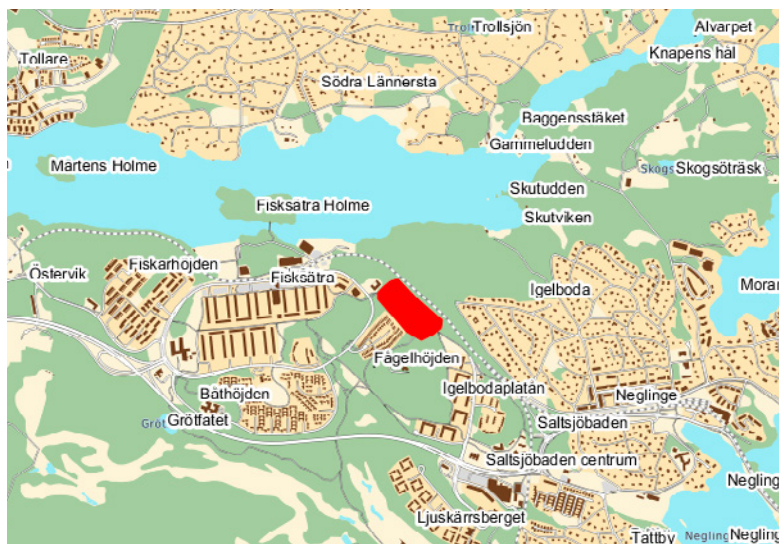
Översiktskarta med markering över området som ingår i markanvisningstävlingen.

Gatuutbyggnaden ska vara färdigställd innan tomterna tas i bruk.