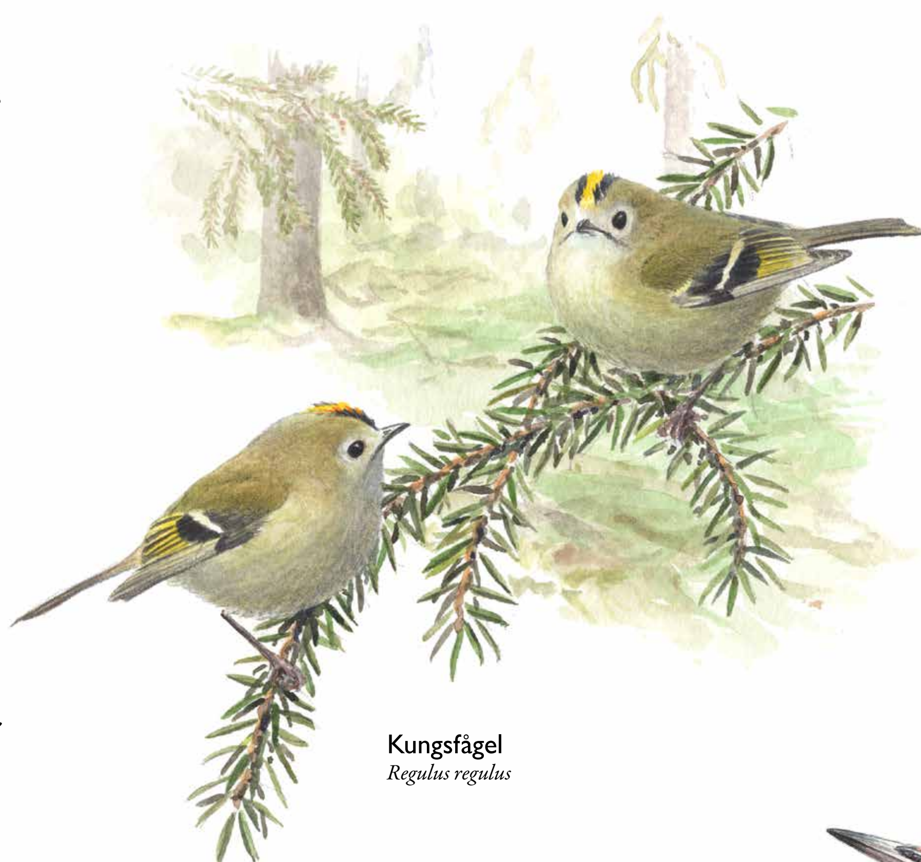
Kungsfågel Regulus regulus

Kungsfågeln är barrskogens karaktärsfågel nummer ett. Den är Europas minsta fågel och känns igen på sin gyllengula krona. När kungsfågeln sjunger låter det som om någon cyklar fram på en gnisslande cykel.