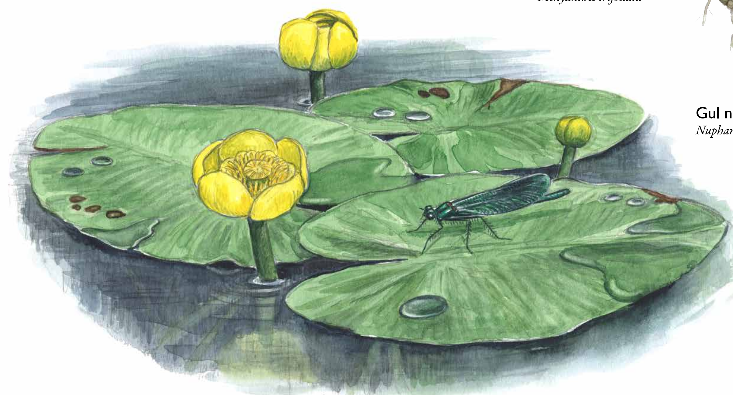
Gul näckros Nuphar lutea