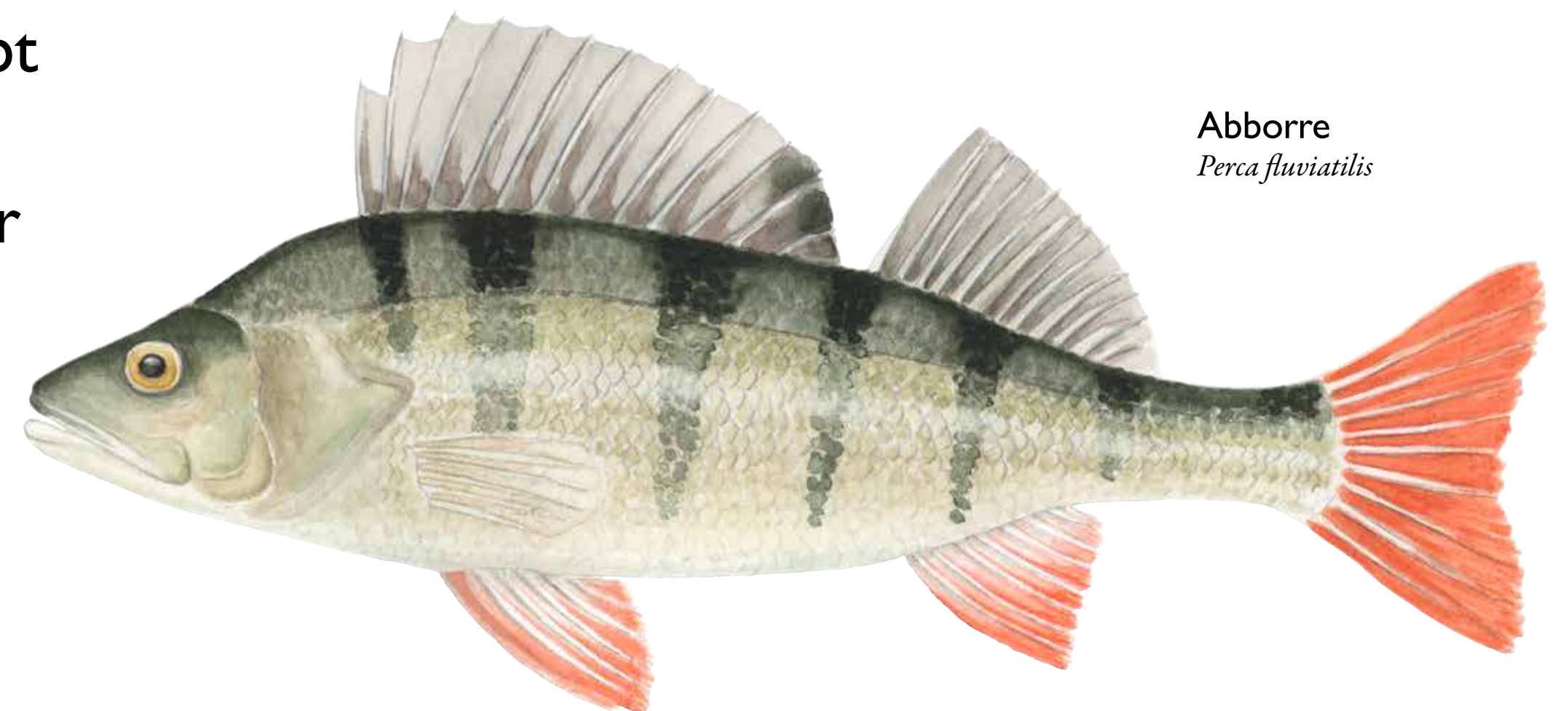
Abborre Perca fluviatilis

Abborrträsk är en näringsfattig, grund sjö med svagt brunt vatten. Växtligheten i sjön är sparsam, men här och var syns vattenväxter som vattenklöver och gul näckros. Om du fiskar kan du få en abborre på kroken!