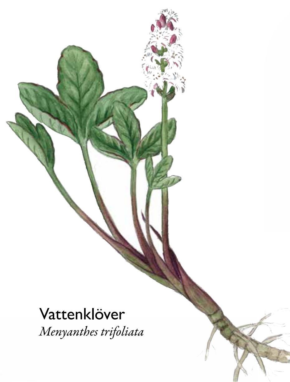
Vattenklöver Menyanthes trifoliata

I gammal skog med murken, insektsrik ved finns ofta gott om hackspettar. Kanske träffar du på gröngöling på din väg genom reservatet eller den svartvita spetten större hackspett.