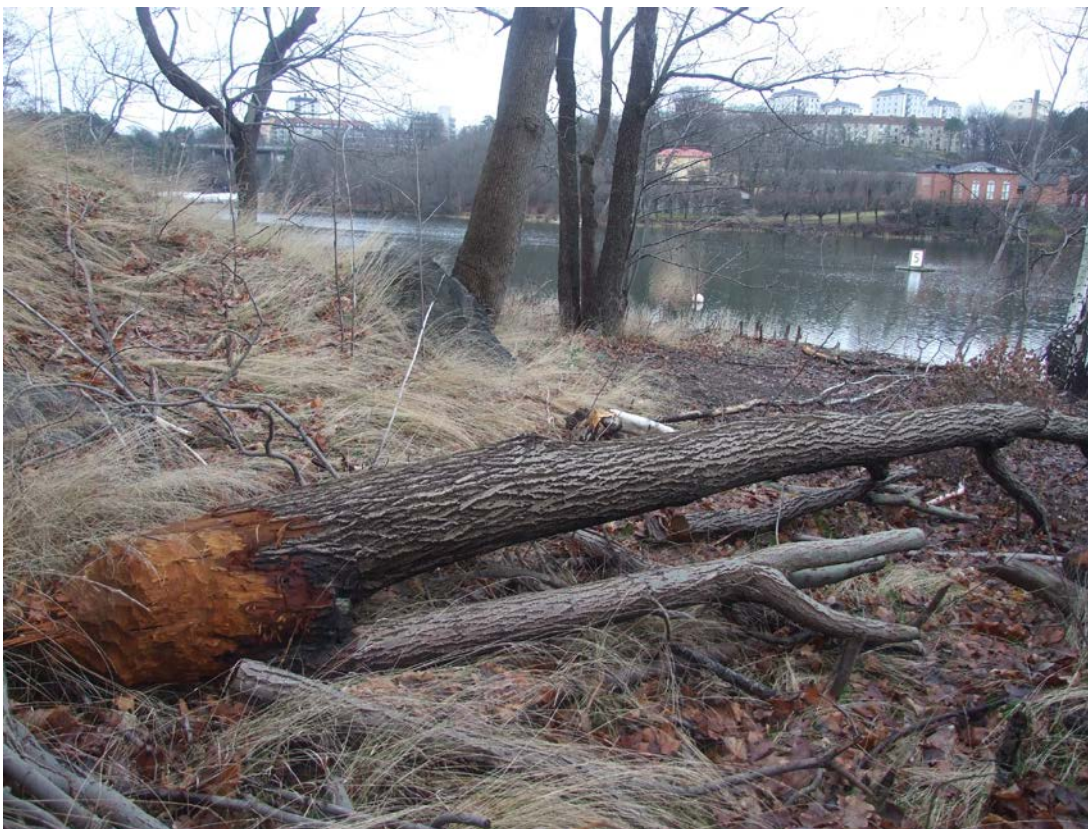
Nya inslag nedanför Henriksdalsberget senaste decenniet; G/C-vägen dragen nära stranden mot Svindersviken och en säl fälld av bäver. Vägen innebar att 100-tals lövträd fälldes.