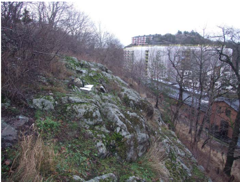
Sydvänd, buskklädd klippa där flora och fauna bör inventeras närmare sommartid.

Fördjupad inventering behöver ske under sommarhalvåret i flera av delområdena. Markfloran inom delområde 1 (branter, sprickdalar, hållar och strandnära lövskogar), 7 och 8 (branter) bör dokumenteras under vår-försommar. Öppna hållar utanför delområdena bör också inventeras. Om möjligt kan även insektslivet undersökas översiktligt eller med hjälp av fällor. Perioden bör utsträckas under hela sommaren.