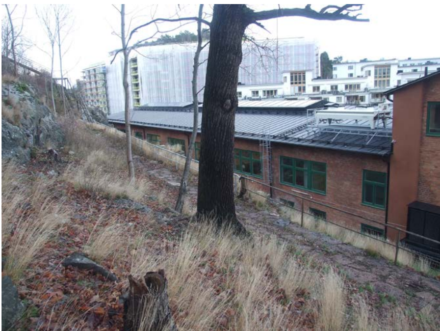
Lövskogsbrant som genomhuggits nyligen och omförs till park

Området har vad gäller branten och brantfoten räknats till det naturvärdesobjekt som för innehåller naturvärden knutna till tall (föregående delobjekt). Naturvärdena i branten är mer knutna till markfloran, brynvegetation och den insektsfauna som är knuten härtill. Dessa värden bör dokumenteras närmare vid lämpligare årstid, förslagsvis försommaren. Tills vidare bedöms naturvärdena vara på kommunal nivå.