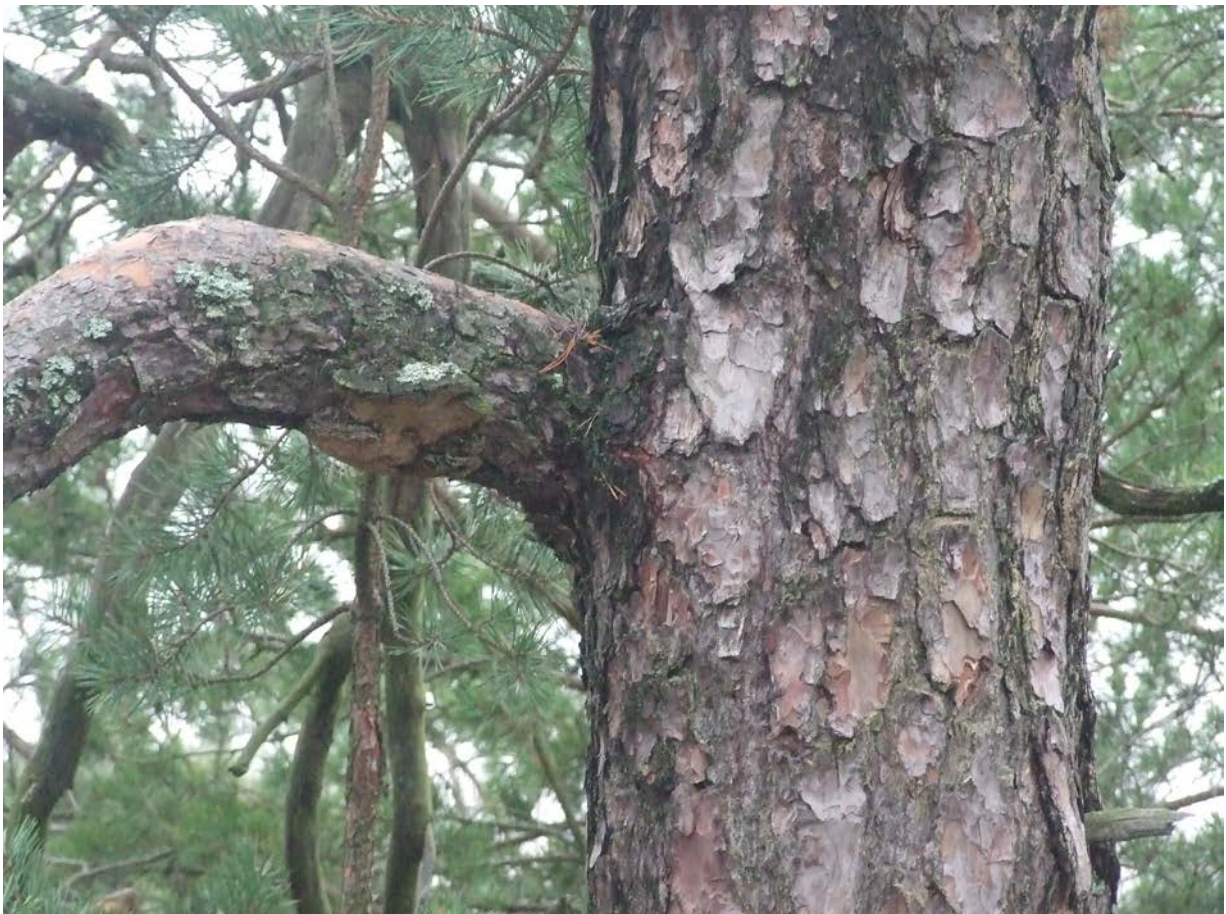
Slät pansarbark och grova grenar med parasiterande tallticka visar på tallars höga ålder.

Området ligger i anslutning till både skola och dagis och utnyttjas flitigt för exkursioner. Genom skogen löper även äldre, stenlagda stigar.