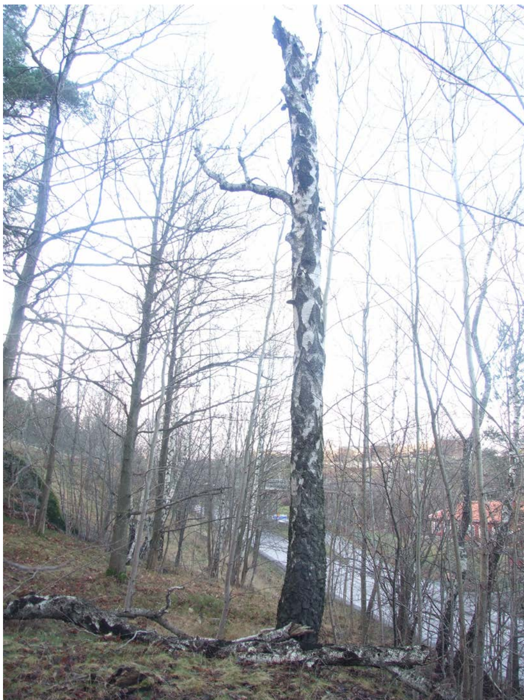
En björkhögstubbe som utgör ett värdefullt inslag av död ved som gör skogen mer levande.

Större delen av skogsbeståndet har ej den höga ålder som krävs för nyckelbiotopklass och har därför ett något lägre naturvärde än tallskogen i övrigt på Henriksdalsberget. Här finns mindre partier som håller nyckelbiotopklass och i övrigt spridda äldre tallar och döda träd som ger området betydande naturvärde.